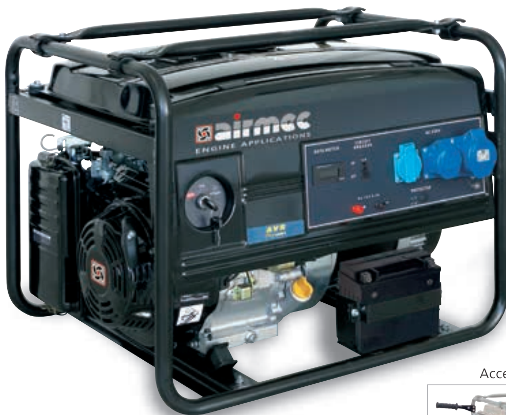
Accessorio - Accessory